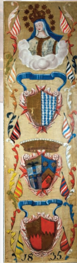
1835, 2 luglio PANTERA l'ultimo drappellone con le armi dei nobili Deputati della Festa di Provenzano

Alcuni drappelloni antichi e moderni dei Palii corsi in onore della Madonna di Provenzano che mostrano come nei secoli vi sia stato raffigurato il simulacro.