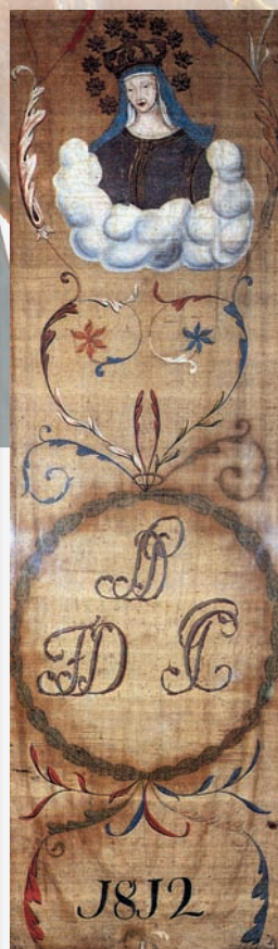
1812, 2 luglio CIVETTA drappellone del periodo napoleonico