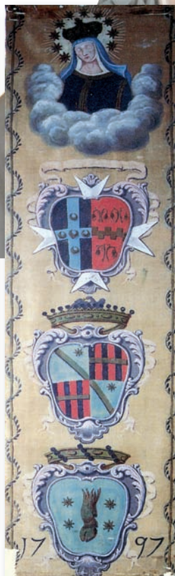
1797, 2 luglio TARTUCA