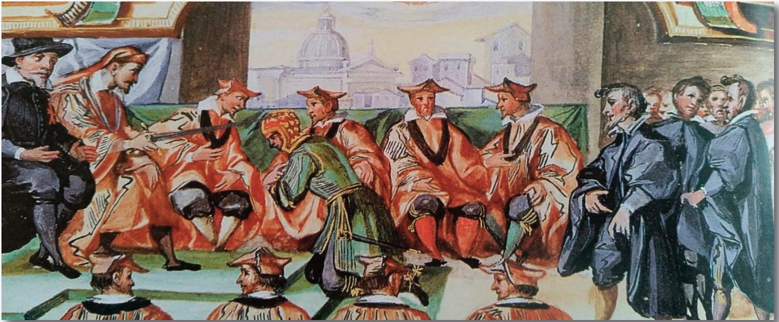
Antonio Gregori, INVESTITURA DEL RETTORE DI SANTA MARIA IN PROVENZANO (1614), pergamena. Archivio di Stato di Siena.