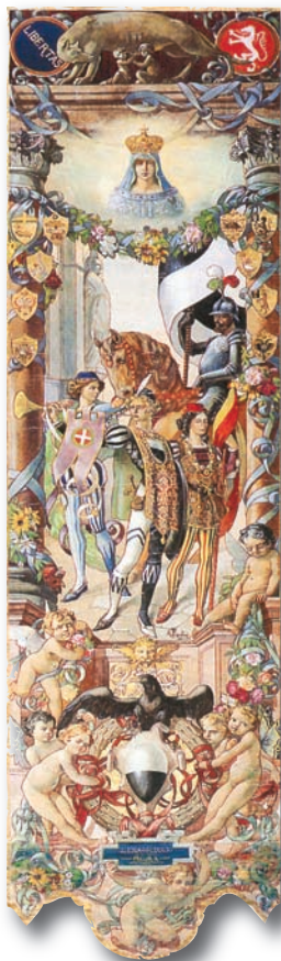
1910, 3 luglio Aldo Piantini VALDIMONTONE