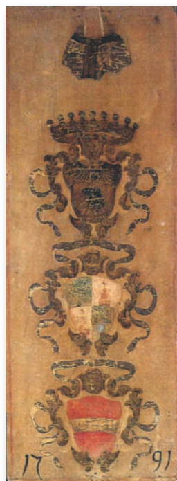
1715, 2 luglio NICCHIO drappelloncino di un masgalano