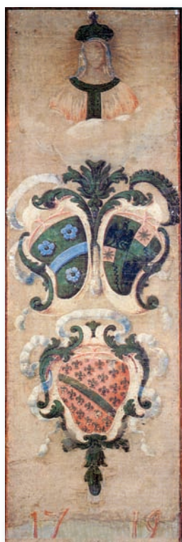
1719, 2 luglio AQUILA il drappellone più antico