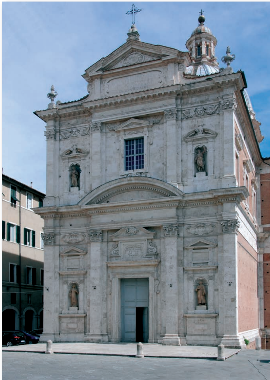
L'Insigne Collegiata di Santa Maria in Provenzano. È intitolata al mistero della Visitazione della Beata Vergine Maria a santa Elisabetta ed è il Santuario nel quale si conserva l'immagine della Madonna di Provenzano, venerata sotto il titolo di "Advocata nostra". In suo onore ogni anno, il 2 luglio, si corre il Palio delle Contrade.