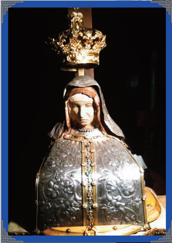
La MADONNA DI PROVENZANO dopo il restauro dell'anno 2000 a cura del Rotary Club Siena.