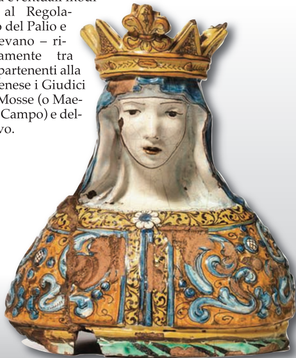
Maiolica policroma raffigurante la Madonna di Provenzano incoronata, veste con disegno in bassorilievo. Siena, prima metà del sec. XVIII.

Dunque, fin dal primo Palio in onore della Madonna di Provenzano (e fino al 1835) l'effettuazione o meno della Carriera di luglio dipese dai tre Deputati Nobili. Essi decidevano il premio da darsi alla Contrada vincitrice, provvedevano alle spese della manifestazione, rivolgevano al Governatore di Siena una supplica scritta per poterla indire, concordavano con i Quattro Provveditori di Biccherna eventuali modifiche al Regolamento del Palio e sceglievano – rigorosamente tra gli appartenenti alla élite senese i Giudici delle Mosse (o Maestri di Campo) e dell'Arrivo.