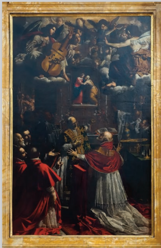
Rutilio Manetti, MESSA DI SAN CERBONE. Collegiata di Provenzano, primo altare.

Drappo di velluto rosso, ricamato a filo oro e riportante le insegne chigiane di papa Alessandro VI.