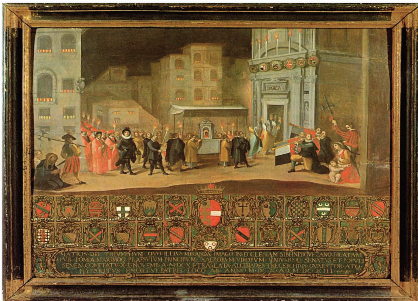
TRASLAZIONE DEL SIMULACRO DELLA MADONNA DI PROVENZANO NELLA CHIESA A LEI CONSACRATA. Archivio di Stato di Siena, Biccherna n. 85 (1610-1613)

l'Opera di Santa Maria in Provenzano, presieduta da un Rettore laico, con il compito di amministrare i beni del santuario e provvedere alle necessità del culto.