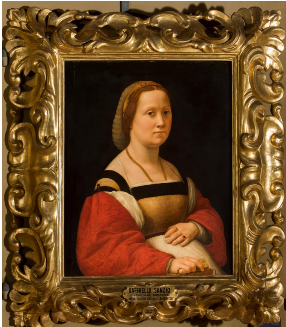
Raffaello, Ritratto muliebre (La gravida) , tavola, 70,5 x 55 cm, Firenze, Galleria Palatina di Palazzo Pitti.