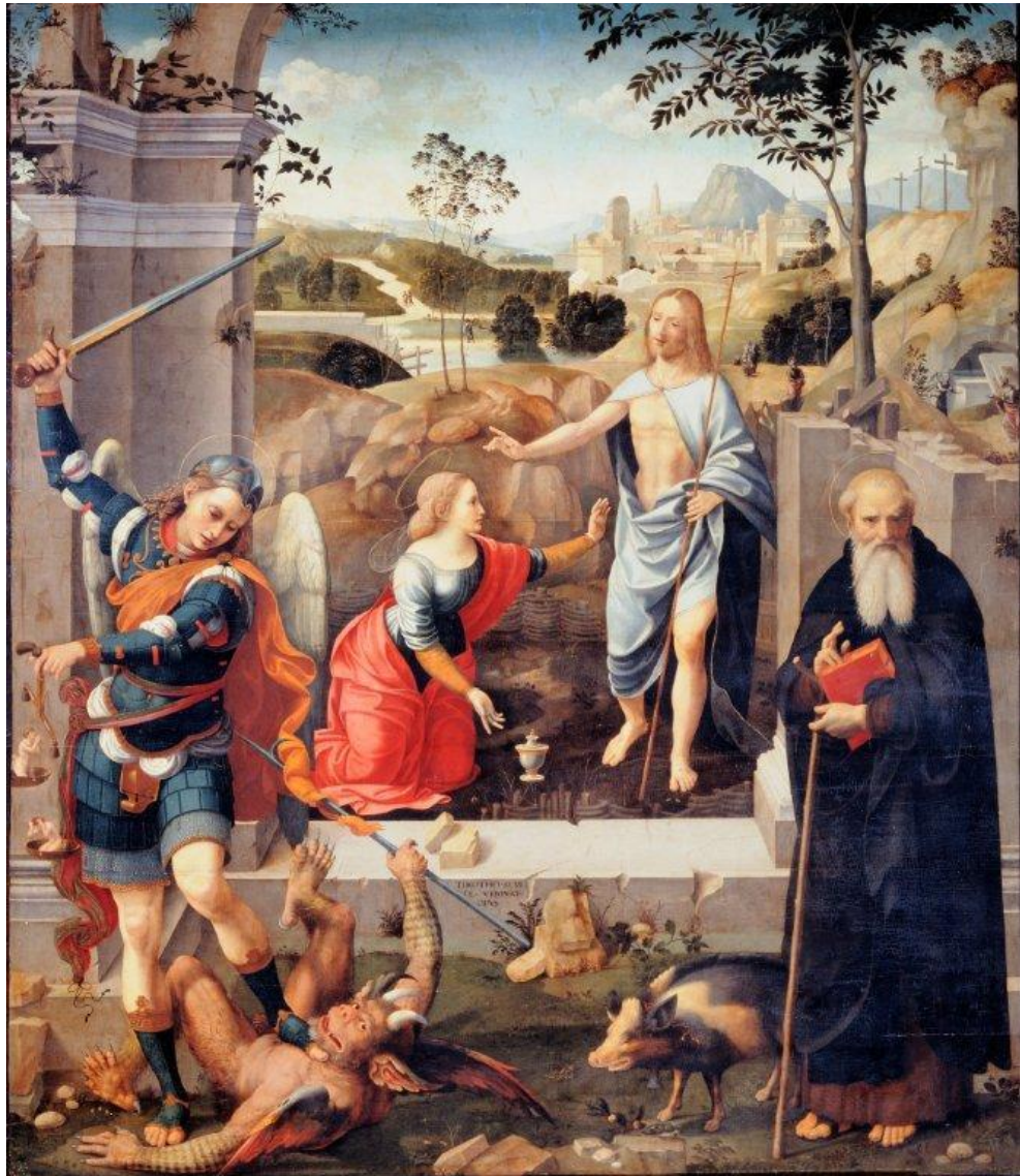
Timoteo Viti, Noli me tangere , tavola, 235 x 207 cm, Cagli, Oratorio di Sant'Angelo Minore.

GALLERIA NAZIONALE DELLE MARCHE PALAZZO DUCALE DI VRBINO