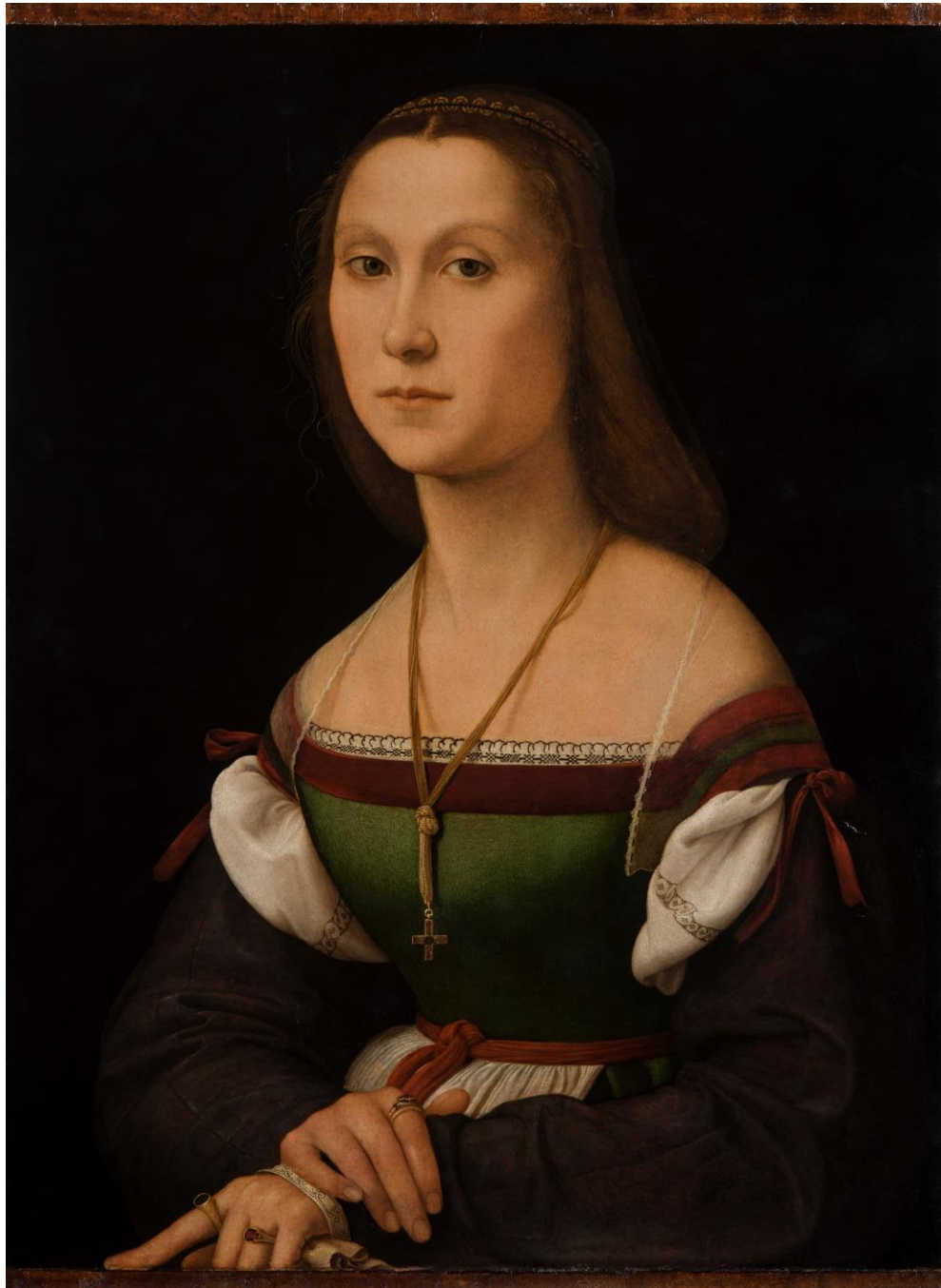
Raffaello, Ritratto di Gentildonna detta La Muta , tavola, 64 x 48 cm, Urbino, Galleria Nazionale delle Marche.

GALLERIA NAZIONALE DELLE MARCHE PALAZZO DUCALE DI VRBINO