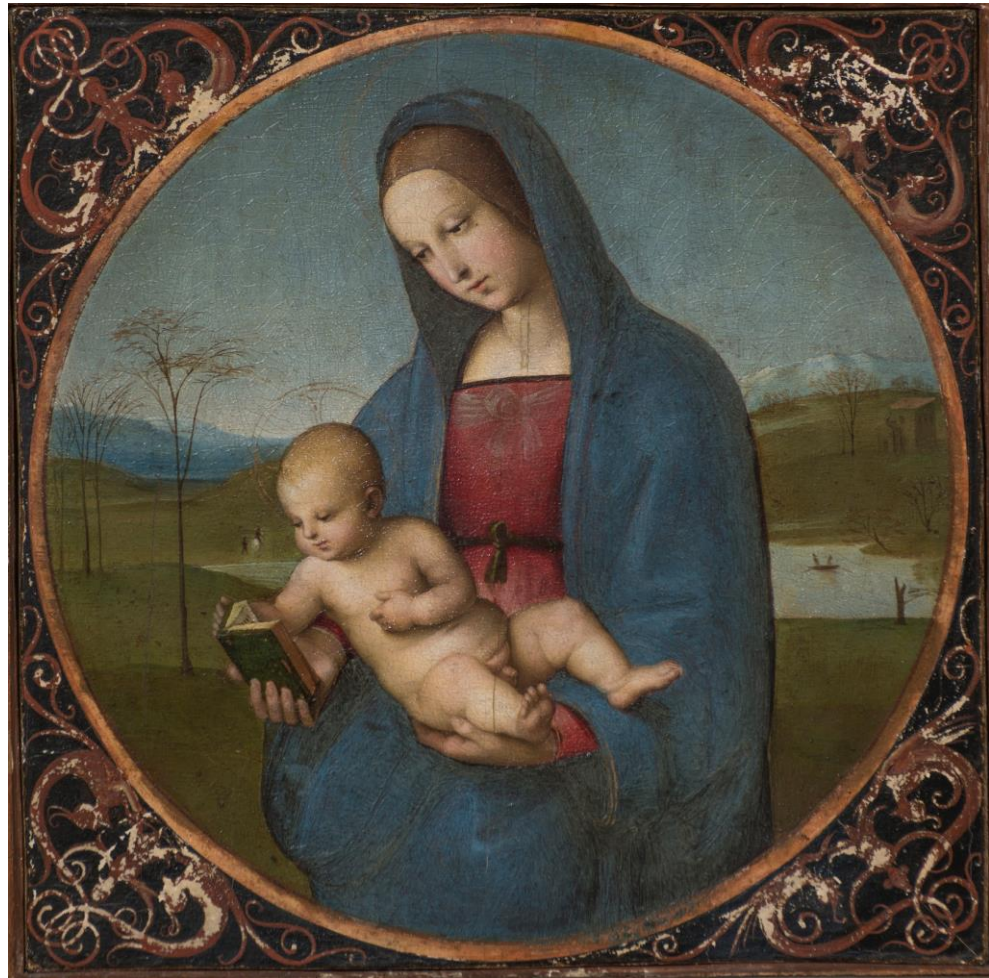
Raffaello, Madonna Conestabile , tavola, 17,5 x 18,0 cm, St. Pietroburgo, Hermitage.

GALLERIA NAZIONALE DELLE MARCHE PALAZZO DUCALE DI VRBINO